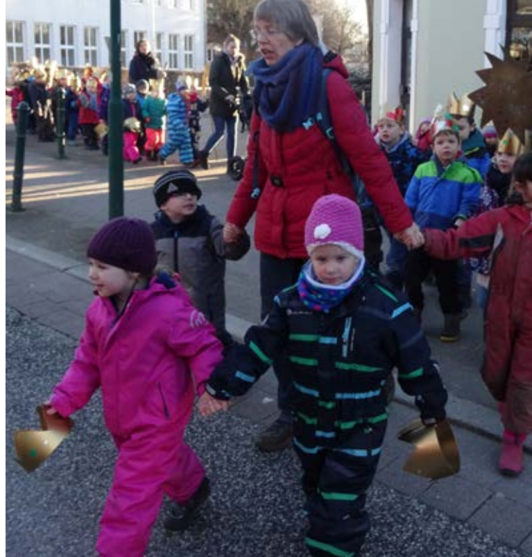
▲ Auf dem Weg in das Rathaus