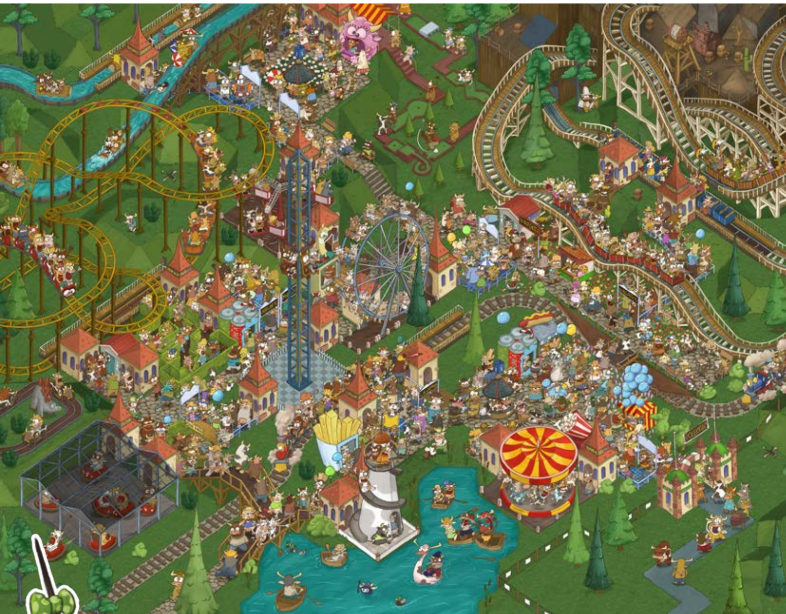
Illustration: © 2018 Tim Löhndorf