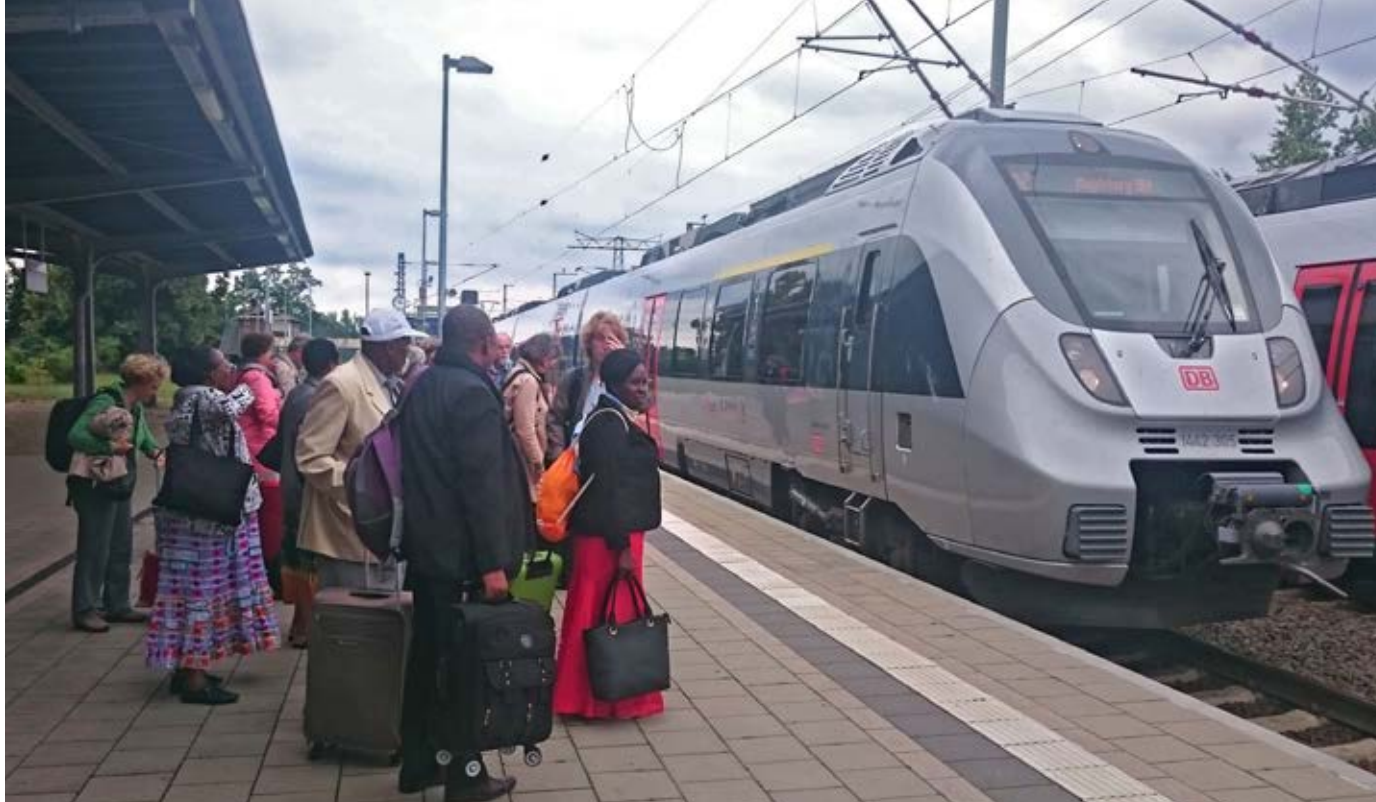
▲ Besuch aus Tansania 2017, ©U. Dagge