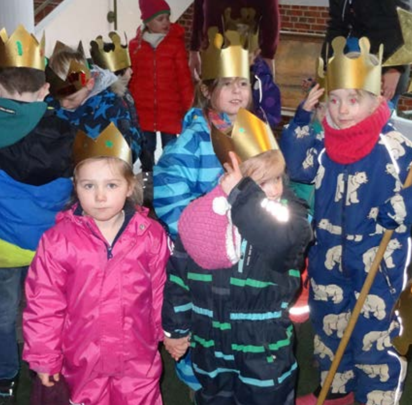
▲ Unsere selbstgebastelten Kronen