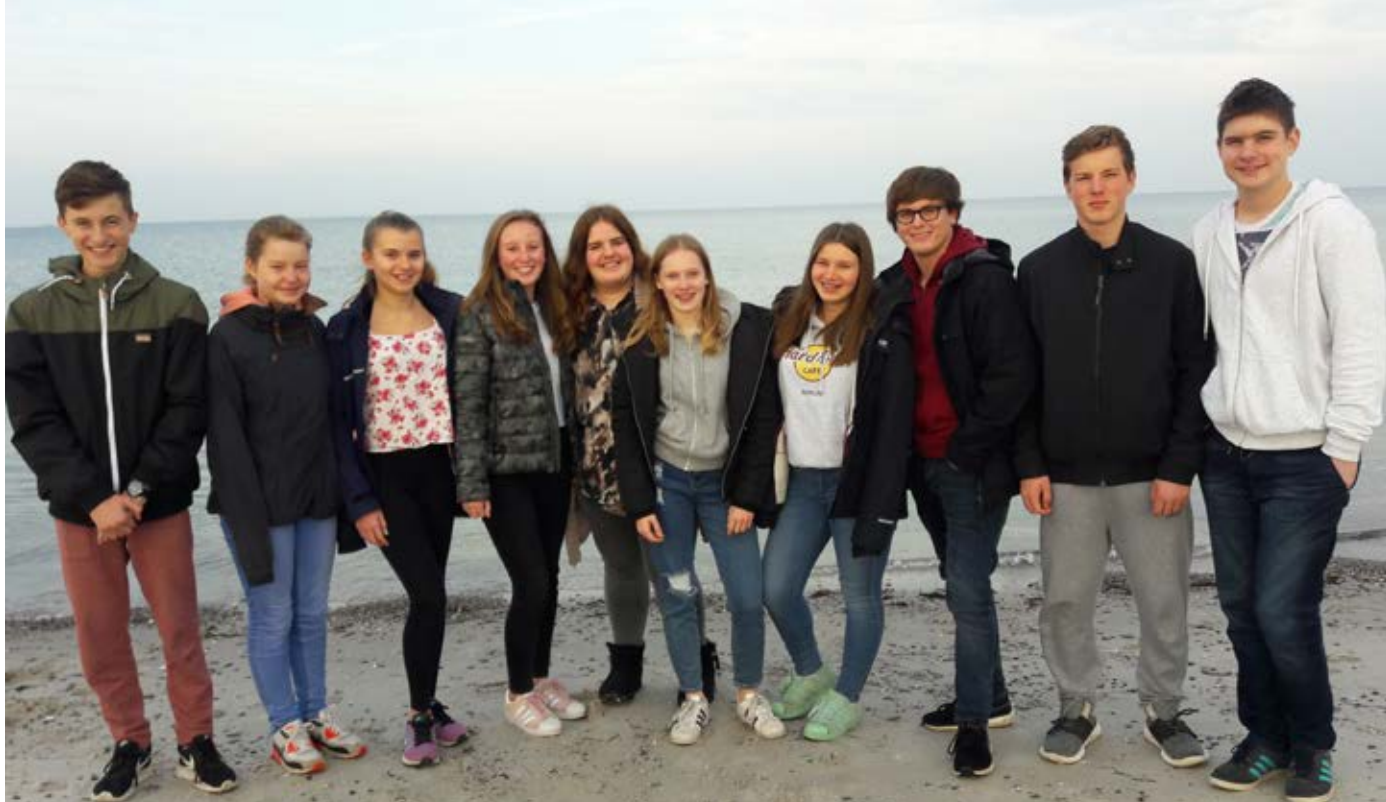
▲ Wir, die neuen Teamer am Ostseestrand in Heidkate